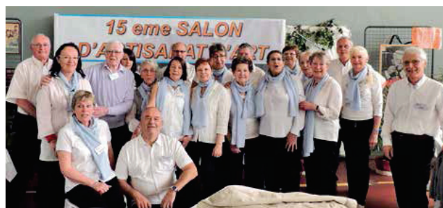
Une partie des bénévoles du Comité lors du dernier salon d'artisanat d'art

La Maison des Associations 11, rue de la Mairie - Tél : 01 39 35 84 27